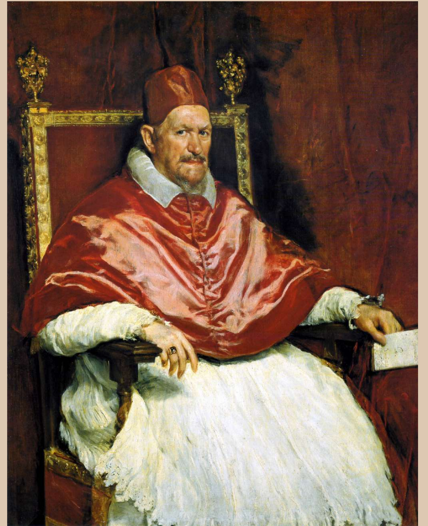
Portret papieża Innocentego X – 1650, 140 × 120 cm, Galleria Doria Pamphili, Rzym