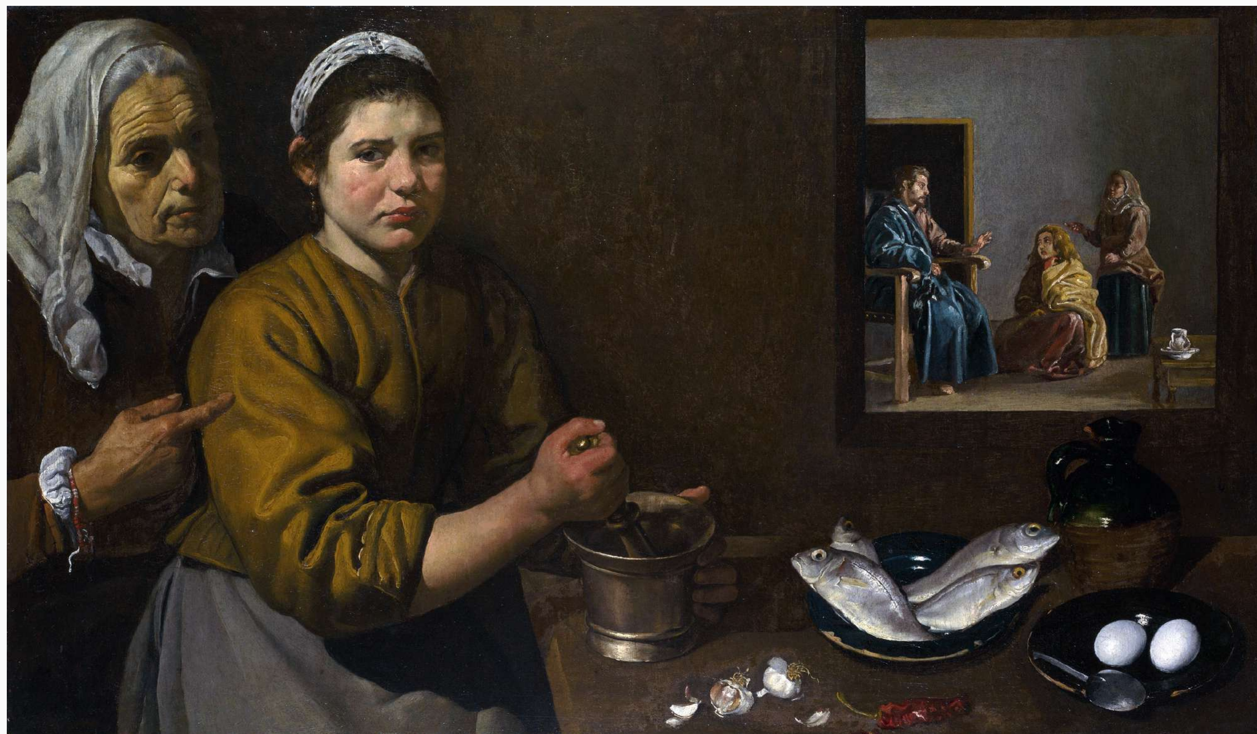
Chrystus w domu Marty i Marii ok. 1618 60 × 103 cm National Gallery w Londynie