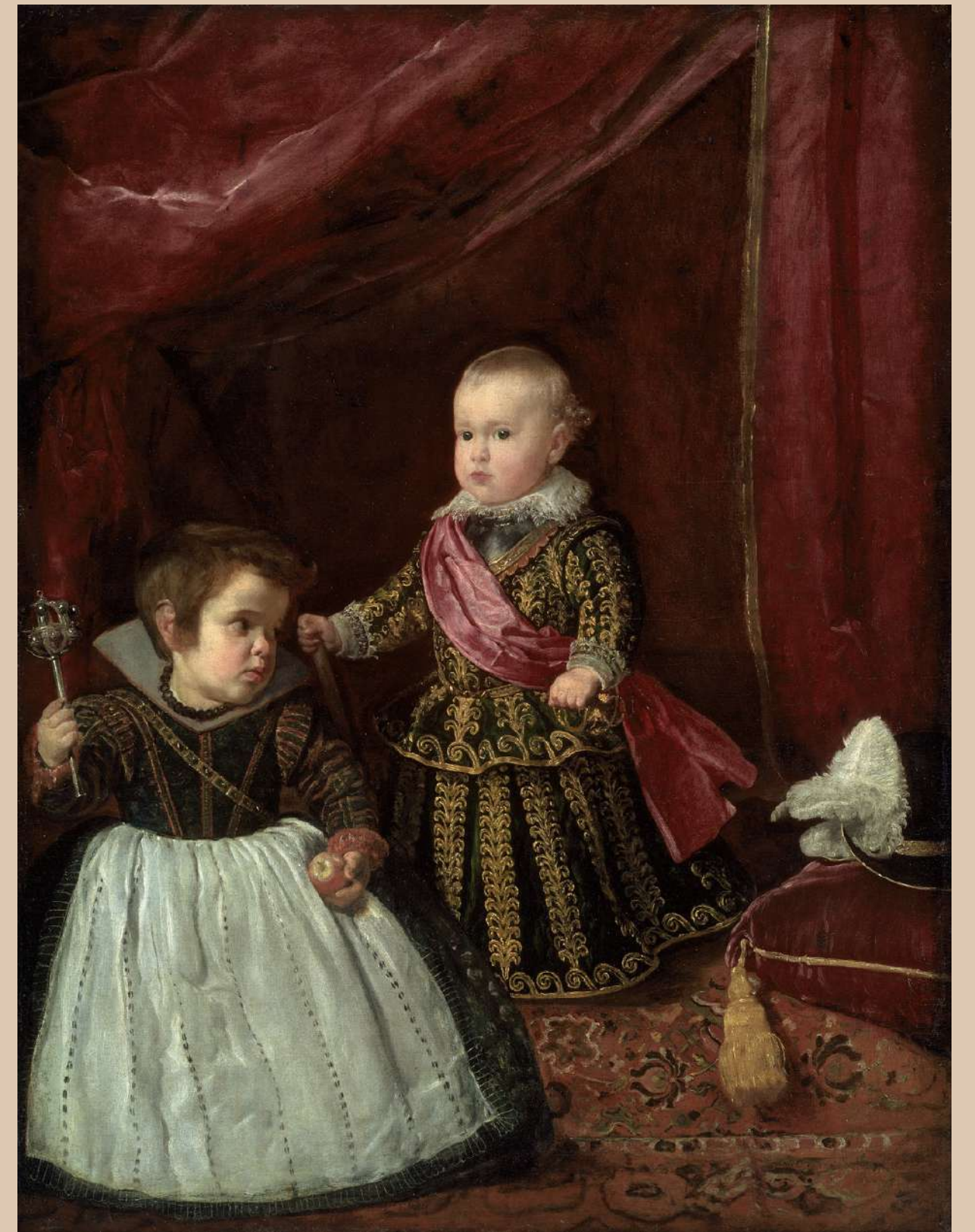
Infant Baltazar Carlos z karlem – 1631, 128 × 102 cm, Museum of Fine Arts, Boston