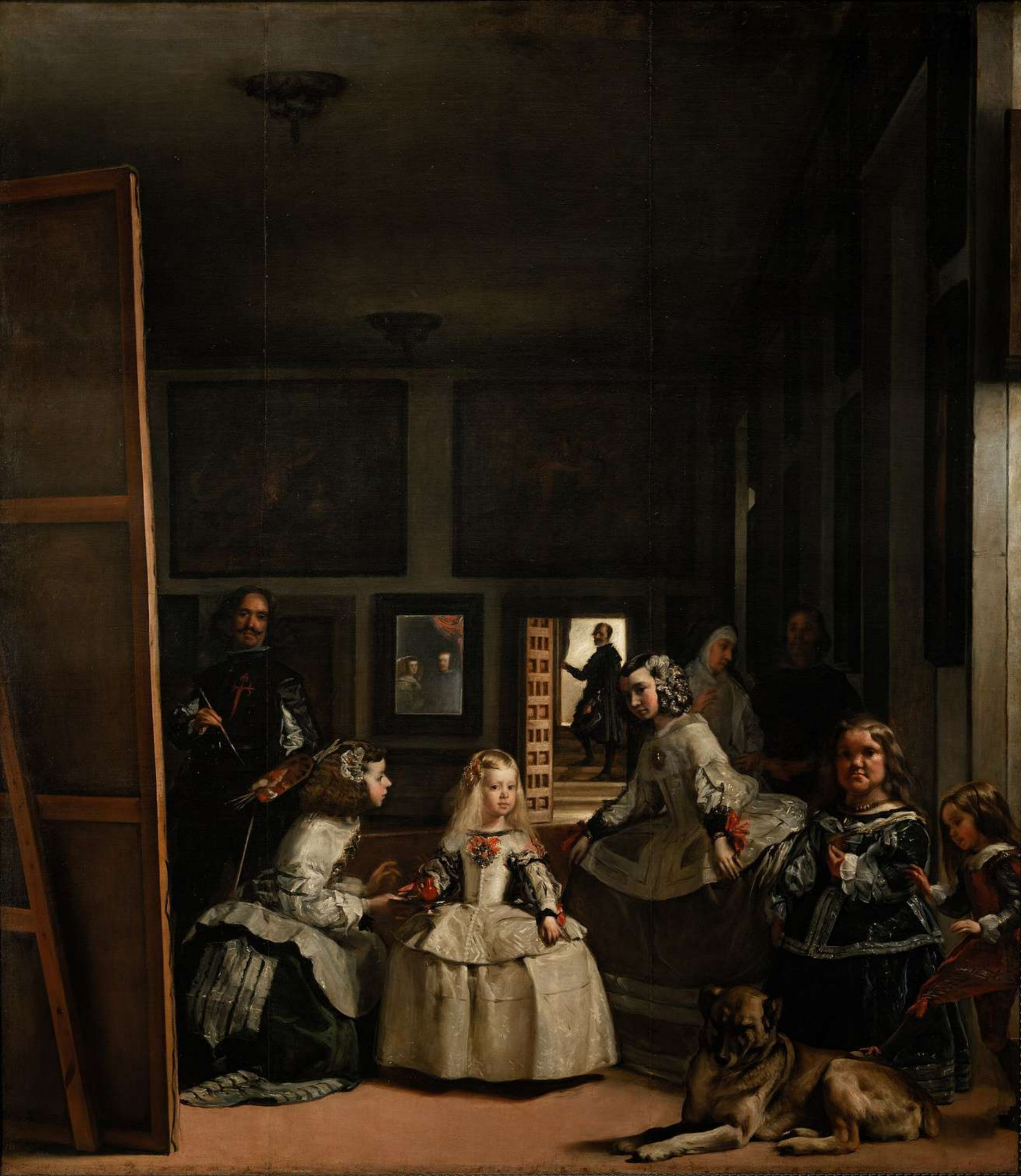
Panny dworskie (Las Meninas) – 1656, 318 × 276 cm, Prado, Madryt