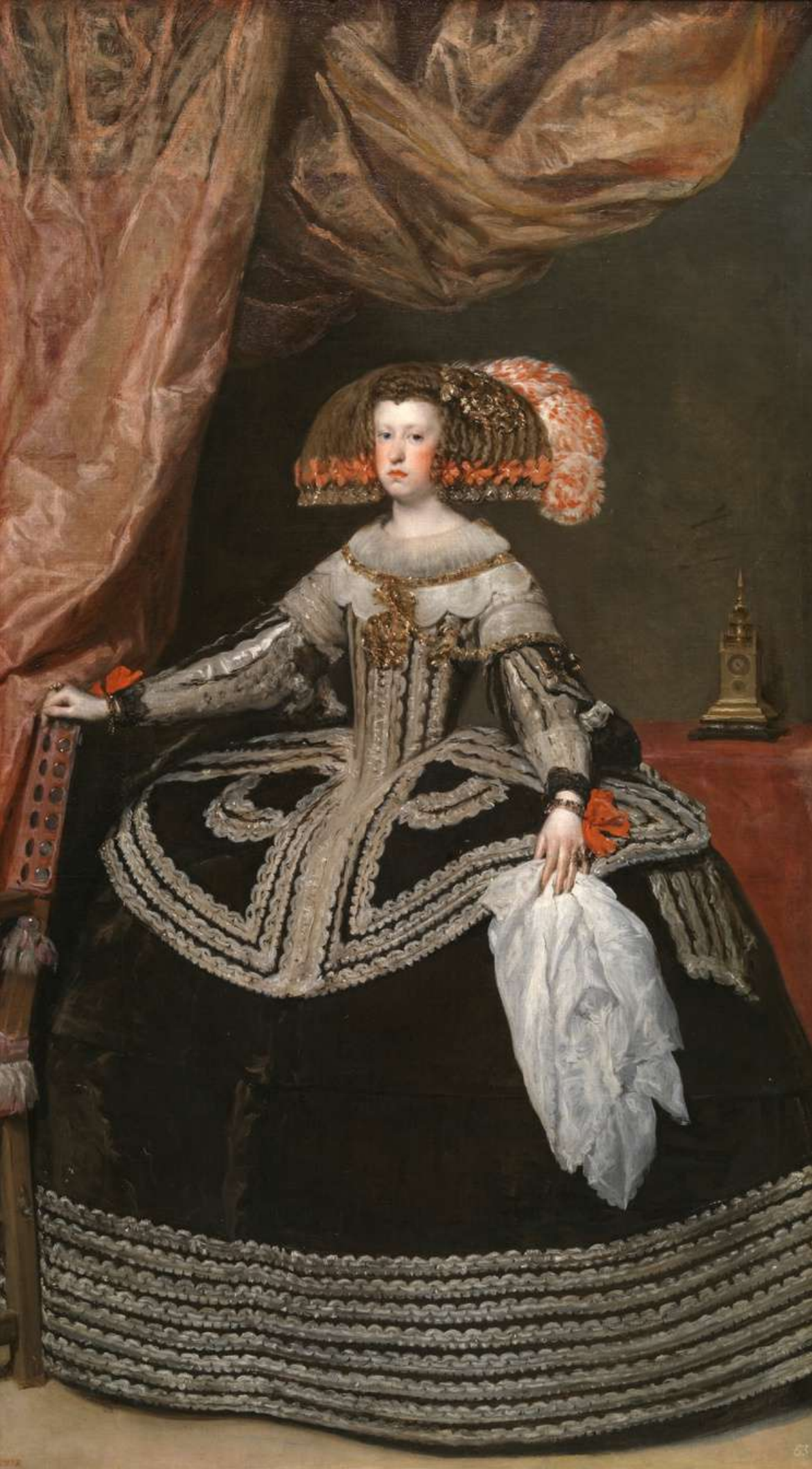
Marianna Austriacka - 1652, 106 x 192 cm, Prado, Hiszpania