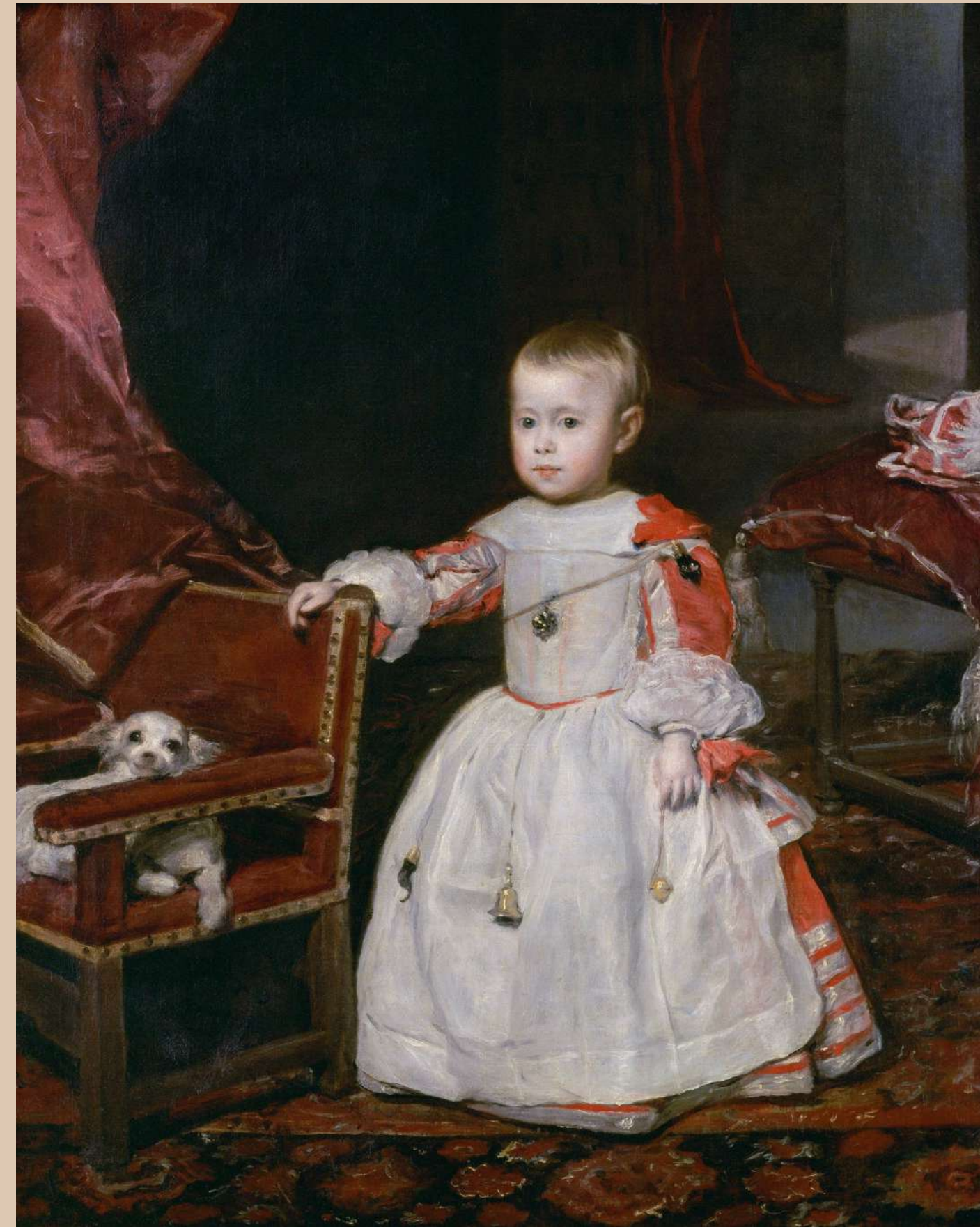
Infant Filip Prospero - 1659, 128 x 99 cm, Kunsthistorisches Museum, Wiedeń