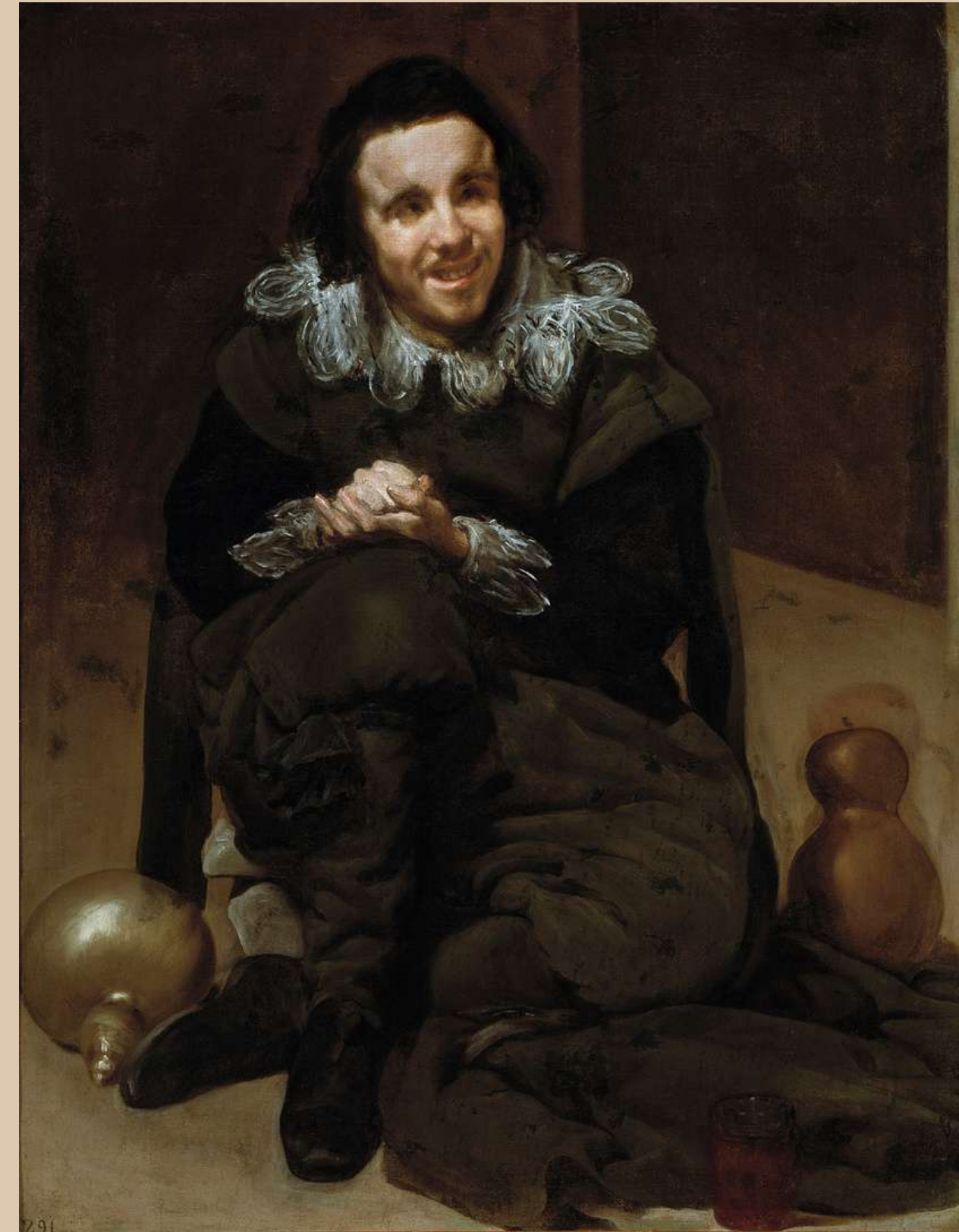
Don Sebastian de Morra - 1643-44, 106 × 81 cm, Prado, Madryt