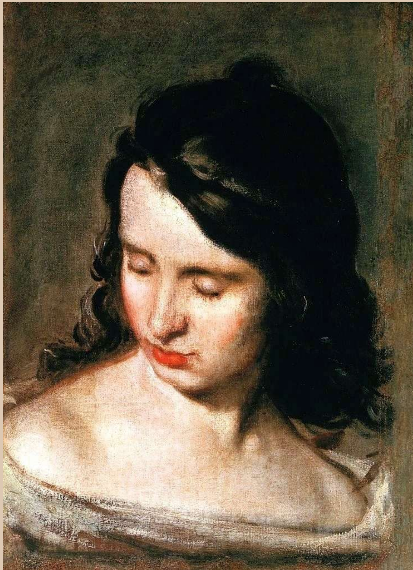
Niewidoma – (II poł. XVII w.), 46 × 35 cm, Muzeum Narodowe w Poznaniu