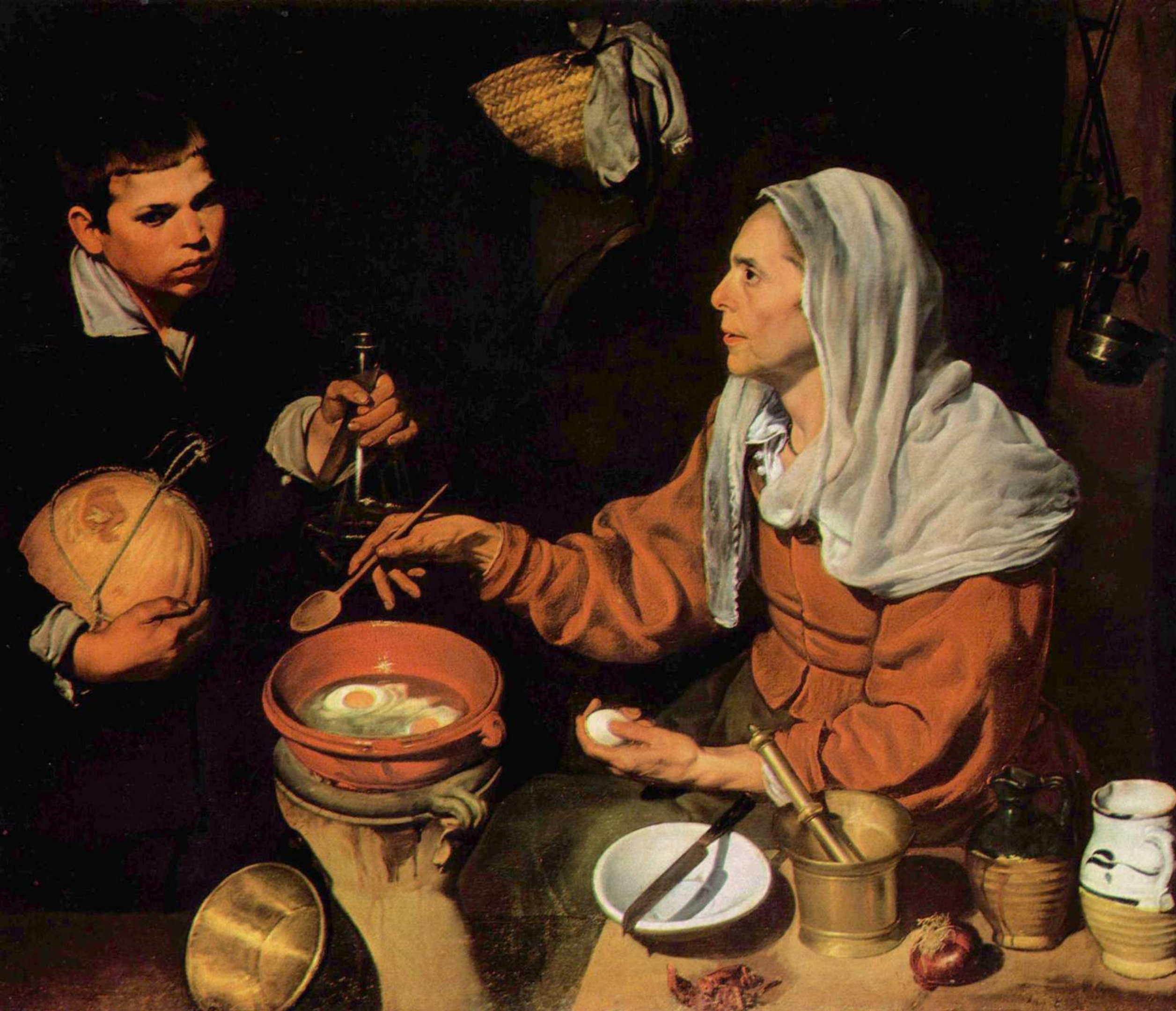
Stara kobieta smaźąca jajka 1618, 99 × 128 cm, National Gallery of Scotland, Edynburg