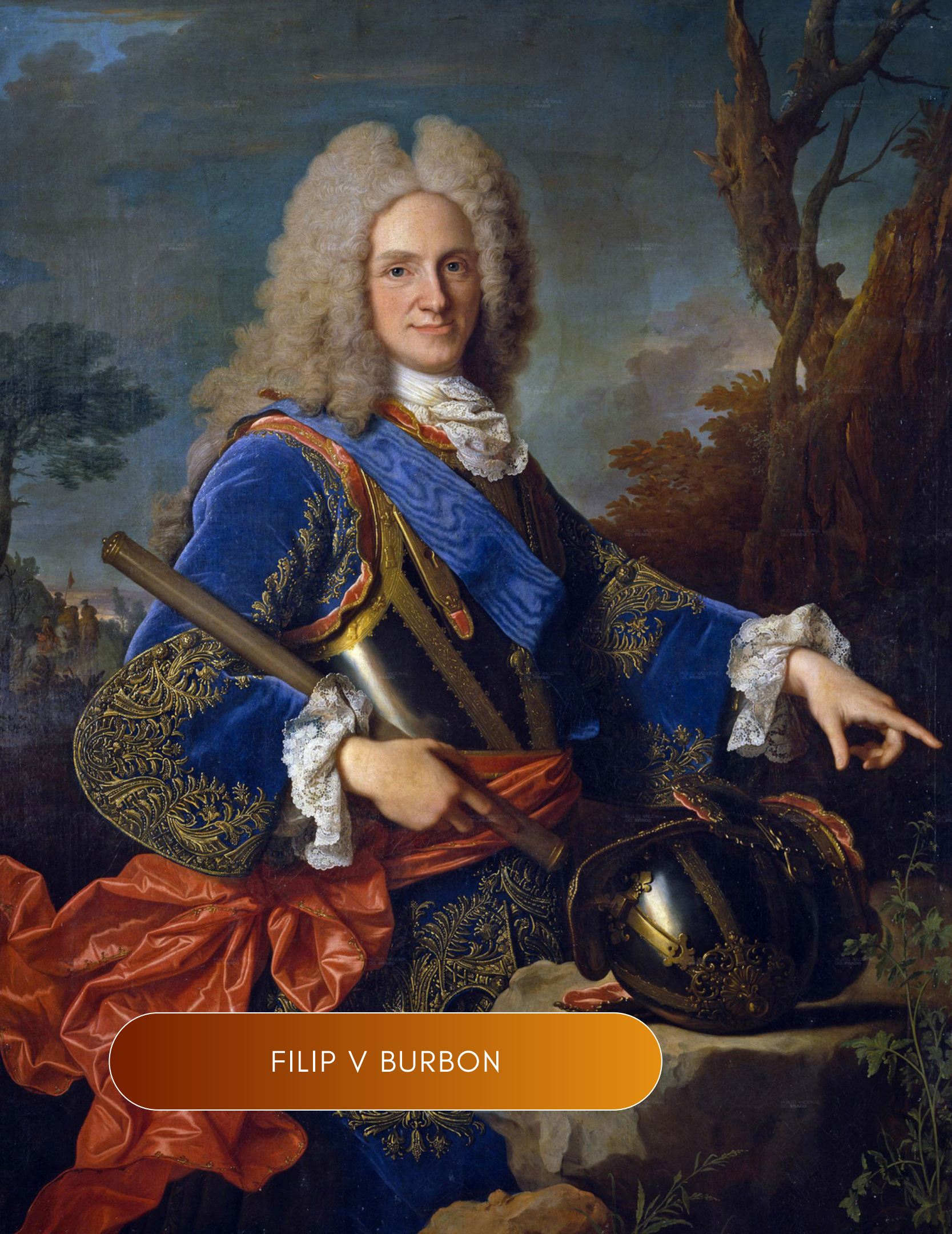
FILIP V BURBON